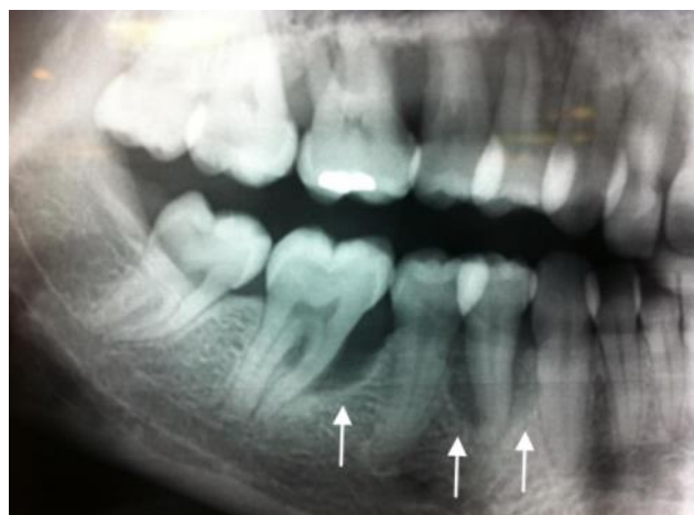
Figura 5: Imagem de radiografia indicando perda óssea vertical em paciente com periodontite.

Em ambas as patologias, existem fatores de risco, como má alimentação, tabagismo, medicamentos que induzem a redução da produção de saliva, alcoolismo, histórico familiar e doenças que deprimem o sistema imunológico. Ressalva-se também como um dos principais a má higienização bucal e a obesidade. Logo, é importante e necessário que dentistas orientem os pacientes sobre a necessidade de combater a obesidade e também sobre a efetiva higiene bucal destacando-o essas medidas como preventivas, afim, de minimizar os riscos da doença. (FONSECA, et al, 2015)