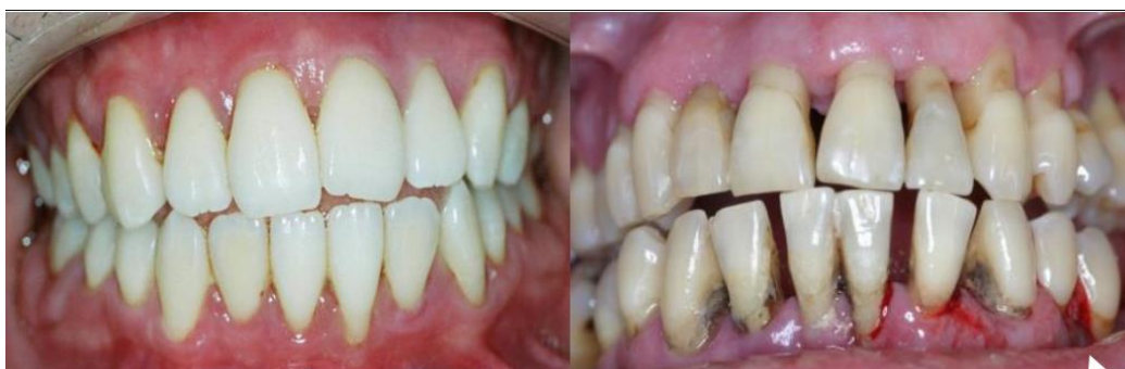
Figura 6: Paciente com periodontite apresentando muito tártaro e inflamação severa. Figura 6: PENAS (2017)

Tal evidências discorridas levam a creditação de que a saúde gengival é extremamente necessária para uma boa saúde bucal. Ainda nesta linha, compreende-se que é um problema de saúde que pode ser prevenido e tem alto impacto social também na vida do paciente. Assim, os cirurgiões dentistas devem orientar a necessidade da execução eficaz medidas preventivas e terapêuticas. (CAMARGO, et al, 2016)