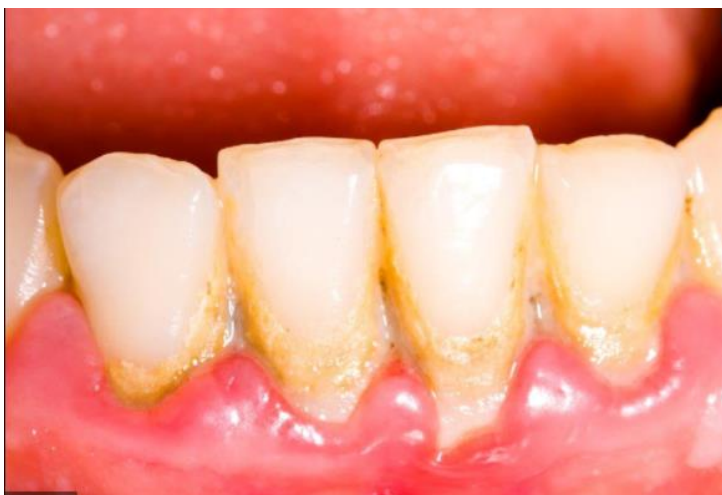
Figura 4: Paciente com gengivite.

uma inflamação localizada nas gengivas com fatores desencadeantes como uma má higiene bucal, além de fatores ambientais como obesidade e tabagismo. Isto é, caracterizada por um processo inflamatório desenvolvido por bactérias inerentes da boca que se aderem aos dentes formando uma placa bacteriana ou biofilme dentário que propiciam o início dos sintomas clínicos como mau hálito, vermelhidão e sangramento, podendo evoluir para periodontite. (CAMARGO, et al, 2016)