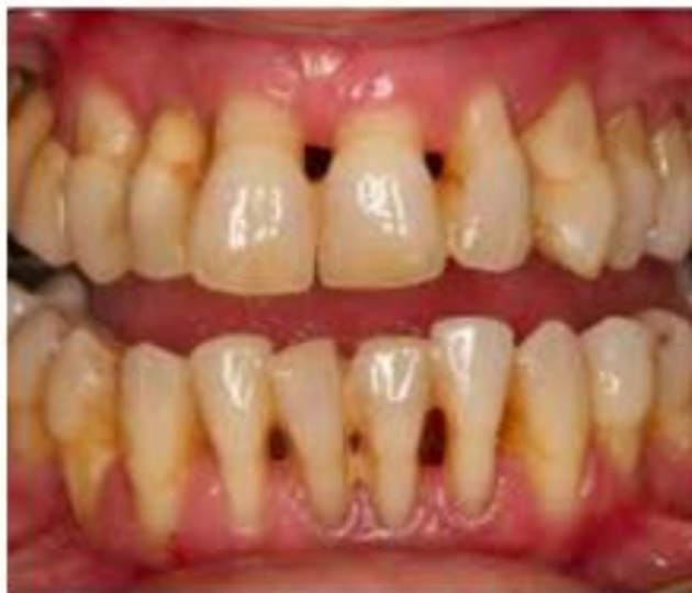
Figura 1: Efeito da obesidade nos cuidados periodontais.