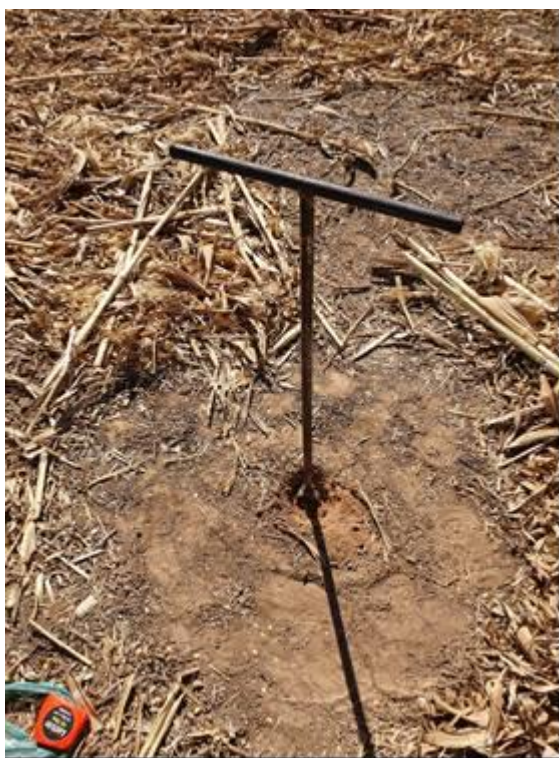
Figura 02 – Local pronto para retirada da amostra após a limpeza dos restos culturais na área cultivada (talhão 13).