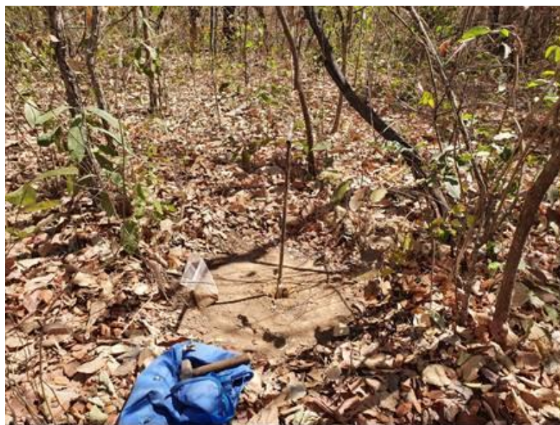
Figura 03 – Local pronto para retirada da amostra após a limpeza dos restos culturais na área cultivada (talhão 13).