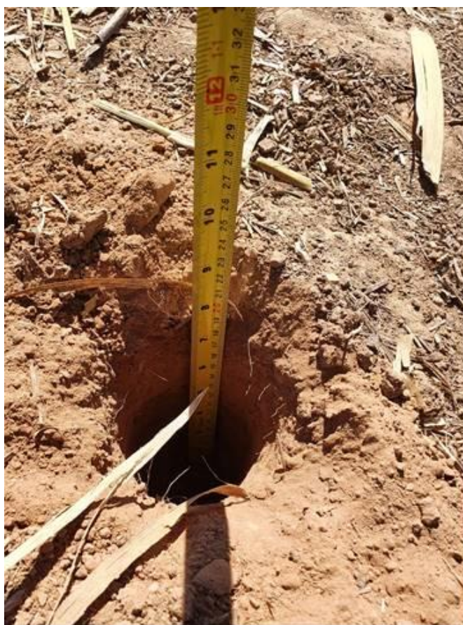
Figura 04 – Profundidade da amostra superficial 10 – 20cm.