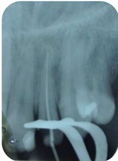
Figura 7 – Radiografia de prova do cone do dente incisivo lateral superior esquerdo (22).

Iniciou-se a obturação com a introdução do cone de guta percha calibrada - (ALLPrime ® , Cheongiu, Chungcheongbuk, Coréia do Sul) número 40 no comprimento real de trabalho de 20 mm e radiografia de prova do cone (Figura 7).