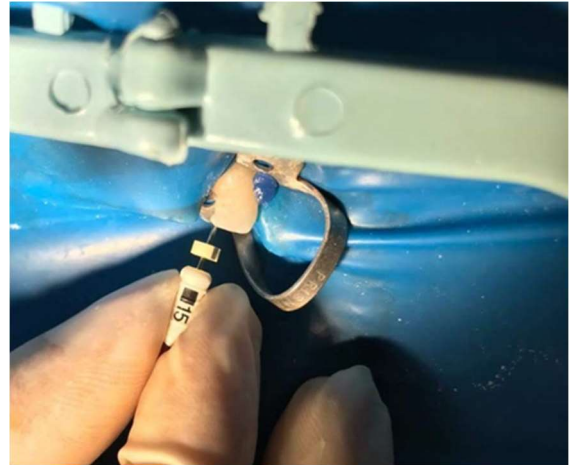
Figura 3 – Exploração do canal com lima K (Dentsply®, Pirasununga, SP, Brasil) 15.

Após a identificação do canal com sonda exploradora 6S (Golgran®, São Caetano do Sul, SP, Brasil), foi realizada a exploração do canal radicular com lima K (Dentsply®, Pirasununga, SP, Brasil) #15 no comprimento provisório de trabalho de 21 mm em cinemática de cateterismo: insere a lima, faz \frac{1}{4} de volta no sentido horário, \frac{1}{4} de volta no sentido anti-horário e traciona a lima para fora do canal (Figura 3).