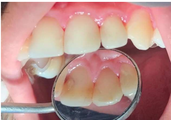
Figura 10 – Exame clínico final do dente incisivo lateral superior esquerdo (22).

Finalizando foi feita a radiografia final (Figura 11).