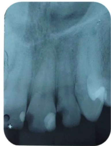
Figura 2 – Radiografia inicial do dente incisivo lateral superior esquerdo.

No exame radiográfico não foram observadas alterações, sendo definido o diagnóstico como pulpíte irreversível, com prognóstico favorável (Figura 2). Em seguida foi realizada a terapia endodôntica em sessão única.