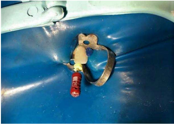
Figura 5 – Odontometria com lima K (Dentsply®, Pirasununga, SP, Brasil) número 25 no dente incisivo lateral superior esquerdo (22).

comprimento provisório de trabalho e radiografia, determinando o comprimento real de trabalho de 20 mm (Figuras 5 e 6).