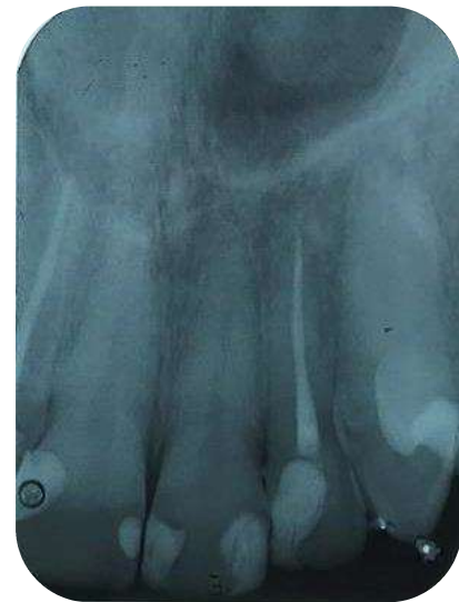
Figura 12 – Radiografia depois de 90 dias de preservação.

Após a endodontia de sessão única, foi feita a preservação há 90 dias (Figura 12).