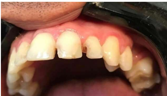
Figura 1 – Exame clínico inicial do dente incisivo lateral superior esquerdo.

Foi então realizada detalhada semiologia endodôntica onde os testes de palpação e percussão vertical foram negativos, já o teste de vitalidade pulpar foi positivo frente ao teste frio.