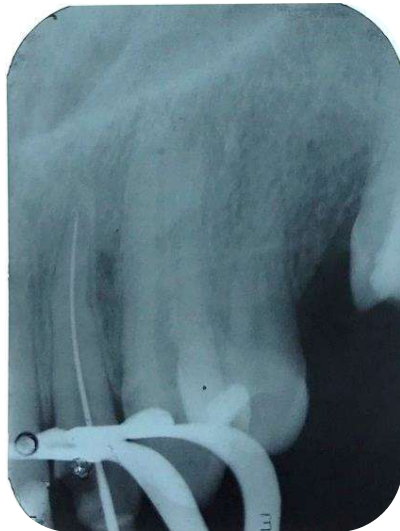
Figura 6 – Radiografia de odontometria do dente incisivo lateral superior esquerdo (22).

A instrumentação do canal foi executada seguindo os princípios da técnica mista invertida, preparado primeiro o terço cervical e médio com brocas de menor calibre para o maior calibre para posterior