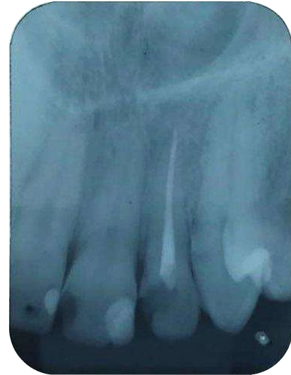
Figura 11- Radiografia final do dente incisivolateral superior esquerdo (22).

Ainda existem controvérsias sobre endodontia em sessão única ou em múltiplas sessões (AZEVEDO, 2018).