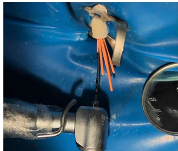
Figura 9 – Condensação termomecânica com a McSpadden (Dentsply-Sirona, York, Pensilvânia, EUA) número 40.

Após o preenchimento do canal foi feita a condensação termomecânica com a McSpadden (Dentsply Sirona, York, Pensilvânia, EUA) número 40 (Figura 9).