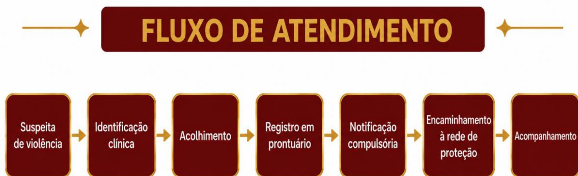
Figura 1 – Fluxo de atendimento para identificação e manejo de mulheres em situação de violência no contexto odontológico.

Com base nos dados levantados, foi sugerido um protocolo contendo orientações sobre identificação de sinais clínicos e comportamentais sugestivos de violência, condutas éticas e legais, fluxo de notificação compulsória e encaminhamento à rede de proteção à mulher, adaptado à realidade institucional e municipal.